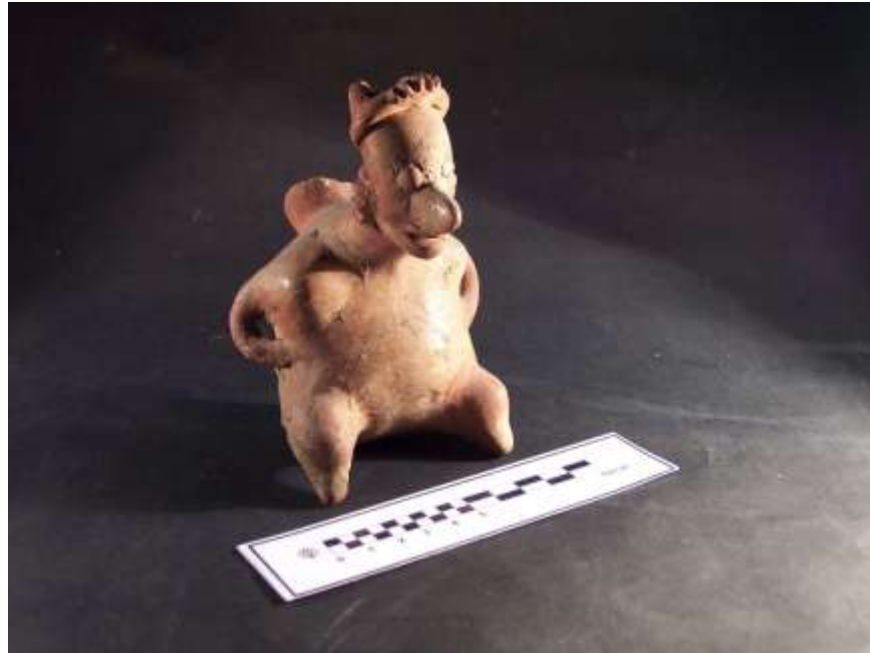
Fig. 4. Figurilla de cerámica de la zona de Tequila

La rica flora y fauna con abundante agua, como en el Volcán de Tequila, los ríos y la barranca, eran muy propicias para la vida de pueblos antiguos. En 2009, muchas piezas antiguas de cerámica y roca, del llamado Valle de Tequila 1 , fueron entregadas al INAH, porque las autoridades locales no se interesaron en ellas. Se dispone de las fotos de las piezas entregadas, que pueden ser materia de otro escrito o de un museo virtual, ya que no se muestran abiertamente otras piezas antiguas de los Valles Centrales de Jalisco, en ningún sitio web . Como ejemplo de dichas piezas, en la Fig. 4 se muestra una hermosa figurilla de cerámica.