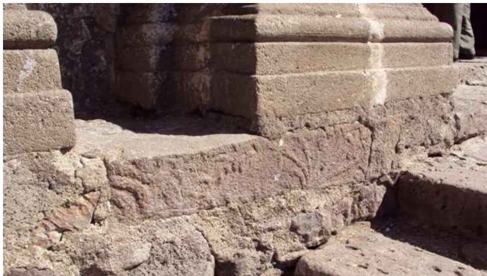
Fig. 2. Petroglifo de la roca con un agave.

El objeto de este documento es dar a conocer y comentar brevemente el petroglifo con un agave ( metl en náhuatl) o mezcal ( mexcal ) labrado en una roca del Templo de la Purísima de Tequila, Jalisco (Fig.1), situada en el frente al lado izquierdo de la puerta frontal (Fig. 2). El petroglifo es visible, porque sus otras superficies planas se usaron para ensamblarla bien con las rocas aledañas. Se observan otras figuras a la izquierda de la roca, pero ya no son muy claras, posiblemente por haber sido dañadas.