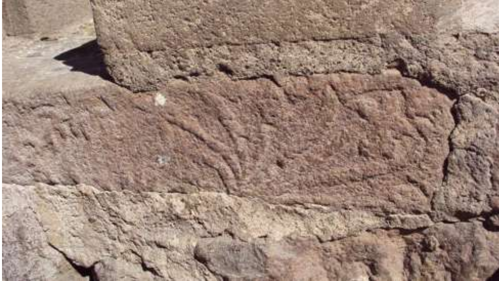
Fig. 1. Agave grabado en una roca

El objeto de este documento es dar a conocer y comentar brevemente el petroglifo con un agave ( metl en náhuatl) o mezcal ( mexcal ) labrado en una roca del Templo de la Purísima de Tequila, Jalisco (Fig.1), situada en el frente al lado izquierdo de la puerta frontal (Fig. 2). El petroglifo es visible, porque sus otras superficies planas se usaron para ensamblarla bien con las rocas aledañas. Se observan otras figuras a la izquierda de la roca, pero ya no son muy claras, posiblemente por haber sido dañadas.