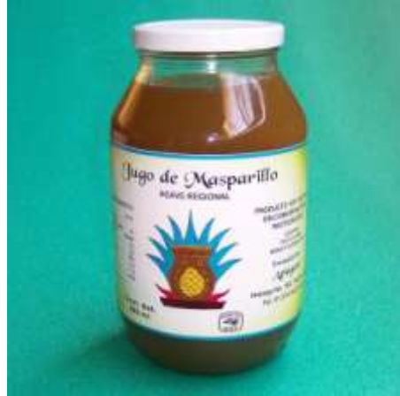
Fig. 4. Jugo de Masparillo, elaborado por mi hermano Guillermo.